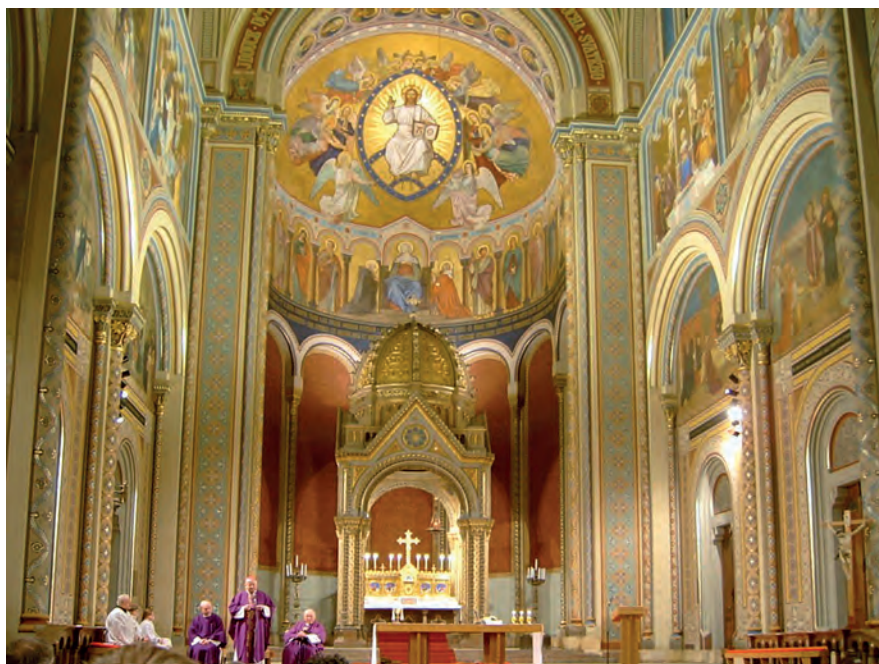
Обр. 4. Св. Богородица на трон със св. Кирил и Методий и апостоли, олтарната апсида в църквата „Св. Кирил и Методий“ (квартал „Карлин“), Прага