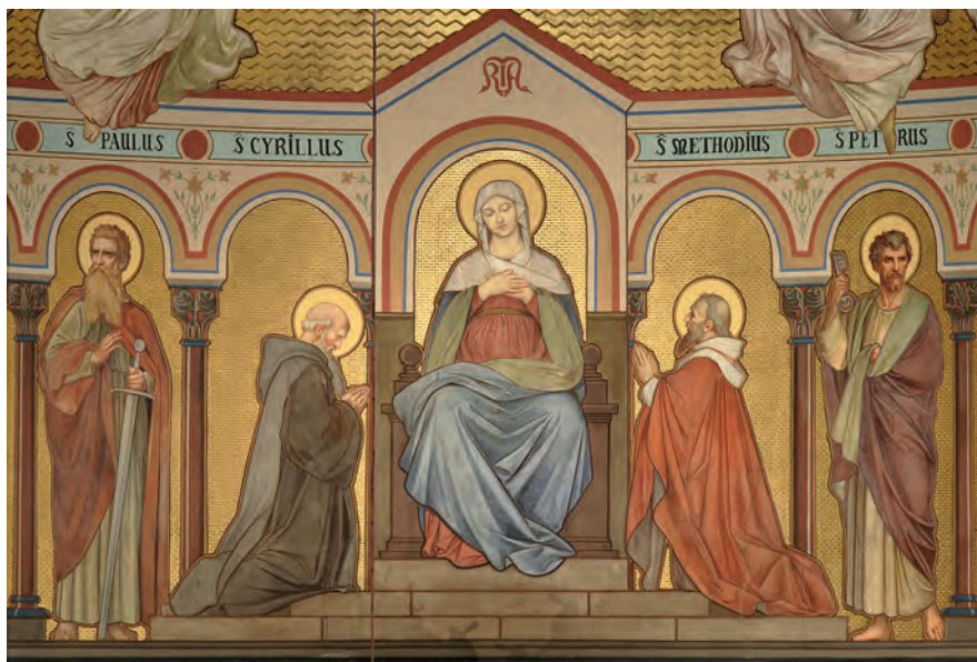
Обр. 5. Св. Богородица на трон със св. Кирил и Методий и апостоли (детайл), олтарната апсида в църквата „Св. Кирил и Методий“ (квартал „Карлин“), Прага