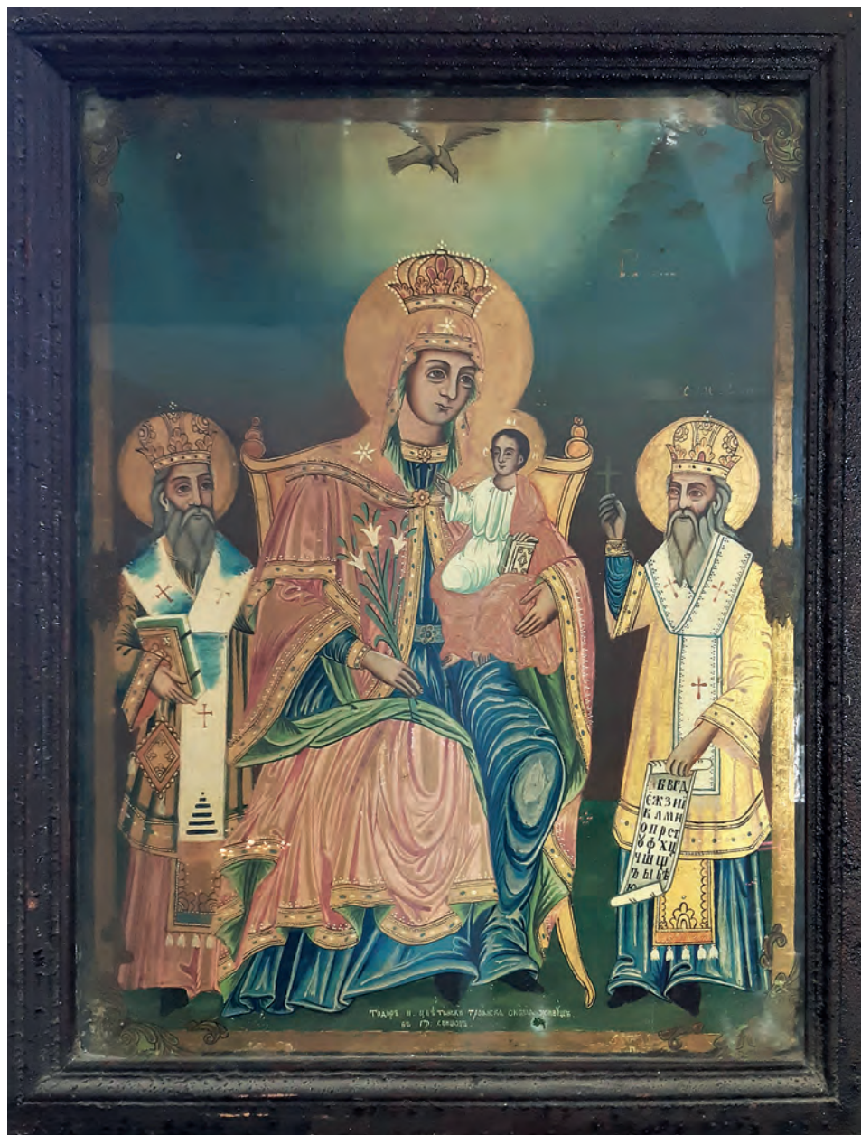
Обр. 3. Икона „Св. Богородица с Младенеца на трон със св. Кирил и св. Методий“, от църквата „Св. Троица“, Свищов