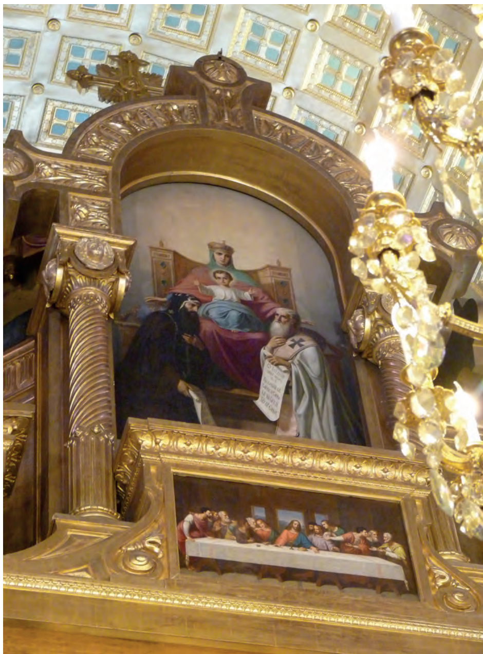
Обр. 1. Икона „Св. Богородица с Младенеца на трон със св. Кирил и св. Методий“, Желязната църква „Св. Стефан“, Истанбул