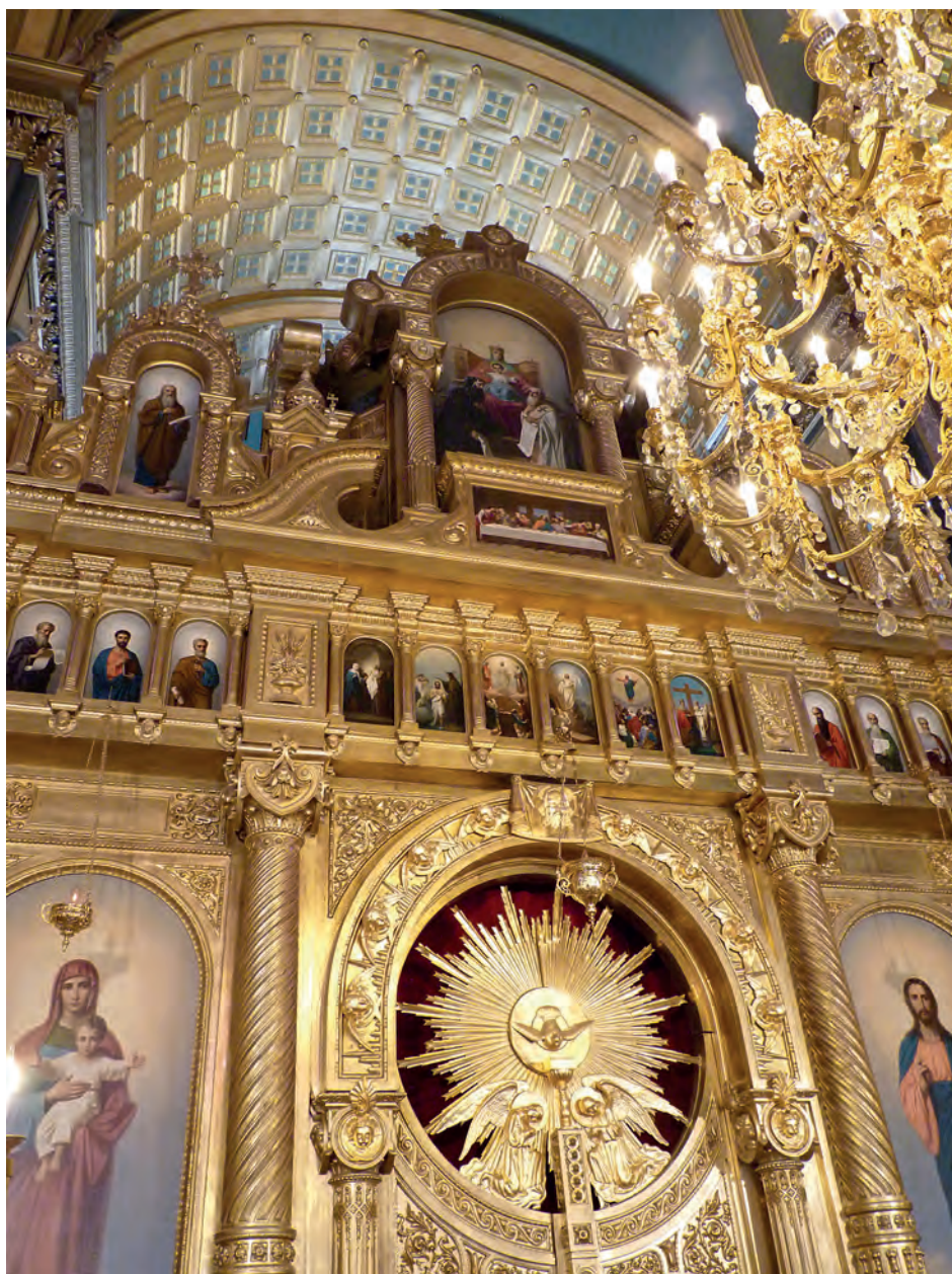
Обр. 6. Централна част на иконостаса на Желязната църква „Св. Стефан“, Истанбул