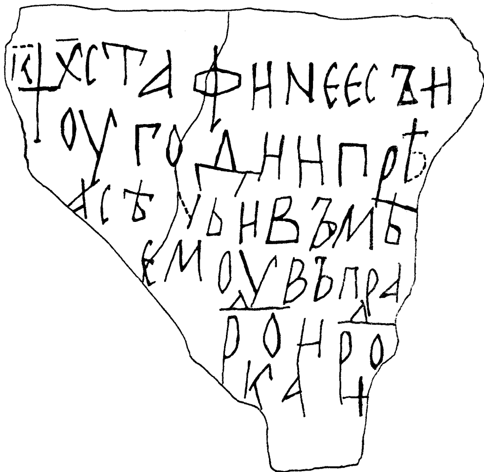
Графит от крепостта край с. Русокастро

цитати върху разтворените свитъци, които държат християнските светци от стенописните изображения (те могат да бъдат обект на специално проучване). Българската епиграфика разполага с няколко лапидарни текста, които по същество съдържат литургични бележки, цитати от Стария и Новия завет или алюзии с тях, така че графитът от Русокастро следва тази традиция. Ще припомним краткия глаголически надпис с вечерен прокимен, двуезичния гръцко-български надпис върху глинена плочка от Преслав, както и надписа с богослужебен текст (отпустителния тропар за осмия ден на вечернята) за 1. XI. от скалния манастир „Св. Безсребърници“ при с. Карлуково 8 . Цитати от Евангелието (Йо 1:1,2,4) се откриват в българо-гръцкия Първомайски над-