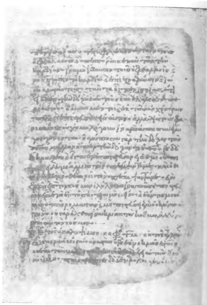
Vat. gr. 2502, fol. 27 r.

Motive — entspricht den Tendenzen der Ausschmückung byzantinischer Unzial-Handschriften aus der zweiten Hälfte des 9. bis zum 10. Jh. In dieser Hinsicht ist in Sav. ein gewisser Einfluß des Minuskelschmucks zu beobachten, wenn wir die knospenartigen Ranken an den Stämmen einzelner Initialen in Betracht ziehen.